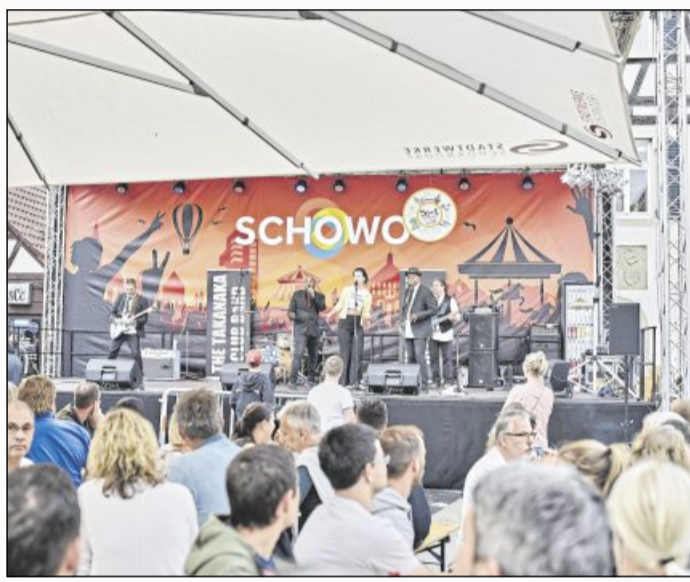
2019 feierte die SchoWo 50+1 Jubiläum.